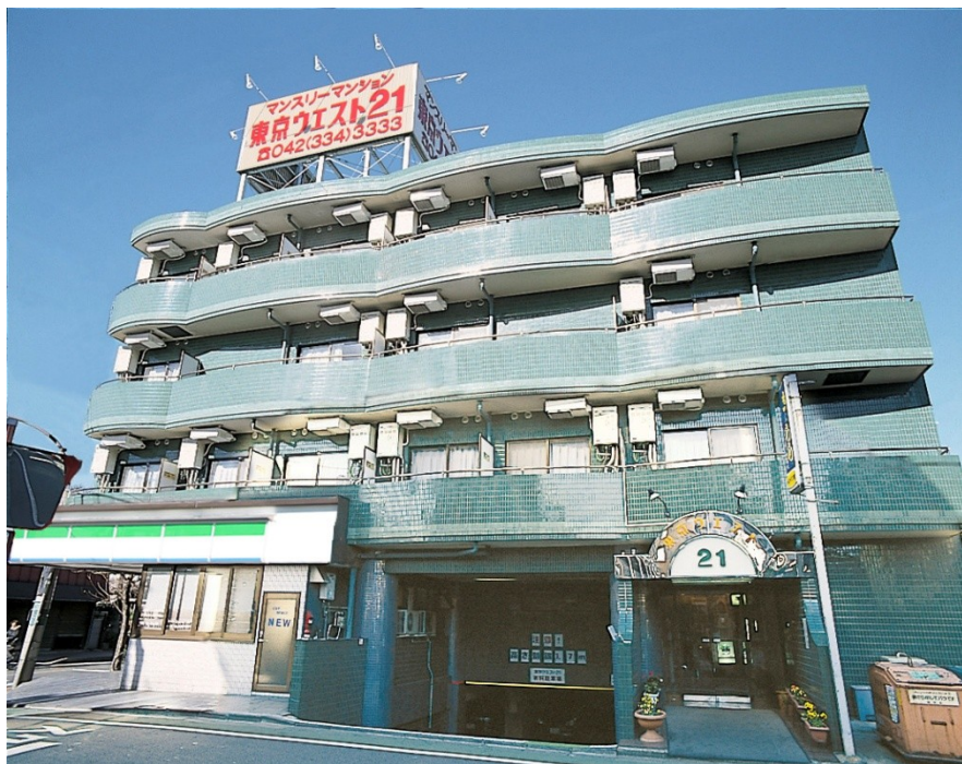
1号館 (受付フロント)